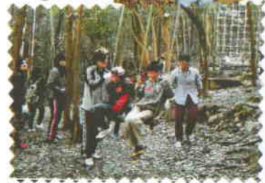
<タマシミウアラシ>