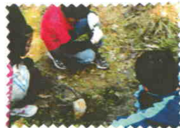
<おたまじやくしを見る>