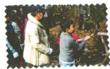
<のこぎりて木をきってみる>