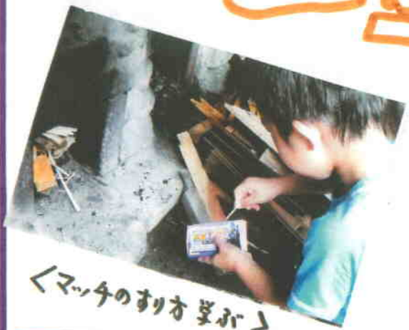
< マッチの割り方学ぶ >

ひとむかし前の、ちょっと不便でも むかしのくらしを、体験して、 見直して、いざ、というとき、 あわてないで、行動したいもの。 そして、節電、節ガス、節水の エコ生活 を心がけよう