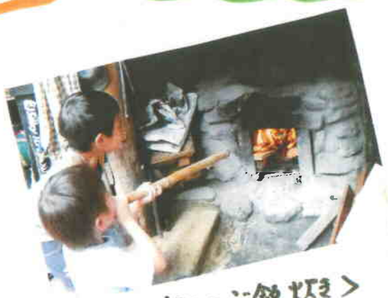
< わらでのご飯炊き >

ランプの宿では、こうした昔のくらし体験が 随時できます。 とくに、子どもたちには、火のおこし方、ご飯の炊き方、まき割りなどを させたもの。何かあっても、 生き抜く力 を、里山でつちかっ ていませう！