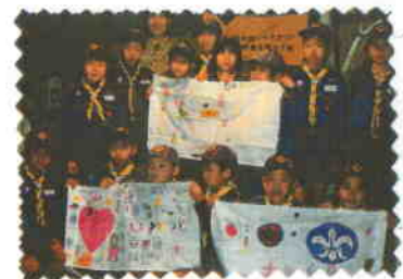
<3/20. ボーイスカウトたち>