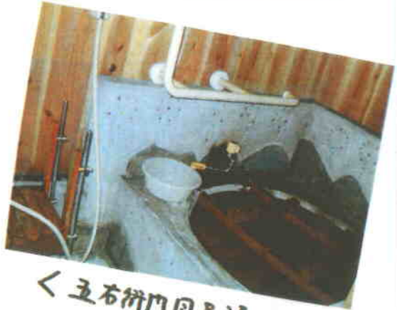
< 五右衛門風呂湯かき入る >

電気、ガス、水道が このたびの様な災害で 使えなくなったら…… 今まで当たり前と 思っていたことも できなくなるのです。