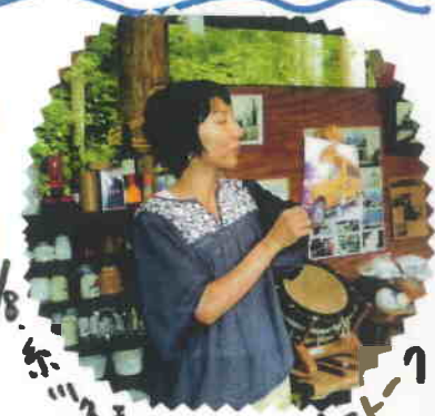
8/8、糸川家のアメリカ子育て

起暑が来た。 この夏休みに 来訪された方、 なんと、70人余り。 忙しかったやー!