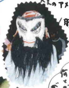
肝だめしては このハロウィンも!