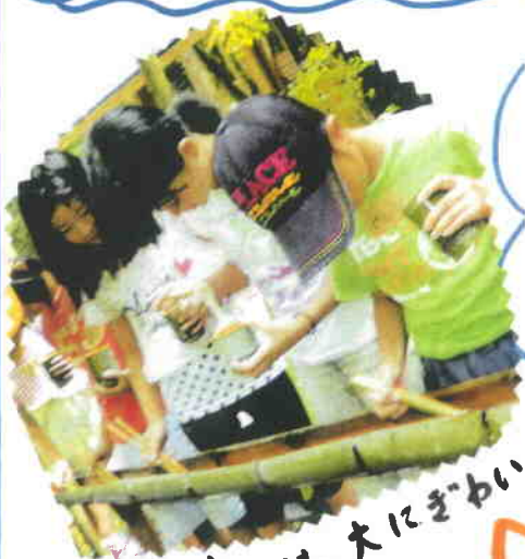
＜リーマン流しは、大にぎわい＞

起暑が来た。 この夏休みに 来訪された方、 なんと、70人余り。 忙しかったやー!