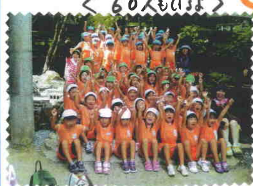
＜8/10、子部から原快幼稚園児たち＞