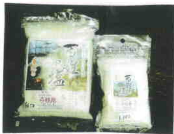
チカラのふりかけクレー!