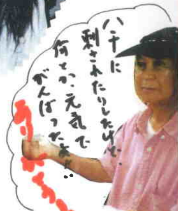
ハチに 刺さふたりしんじゅ 何とかなええで がんばって

子ども夢基金の助成事業「里山昔の暮らし体験教室」は、 7/23～7/24(お1回目)、井園小の6年生、8/19～8/20(お2回目)、八方原 子ども会のおとも、2回、なかまなく、生き、たのしく、できましたこと。 ここに、協力参加者の方々へ、感謝お礼を申し上げます。