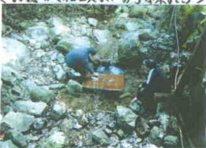
<冷たい川の水で、板の粉を落とす>