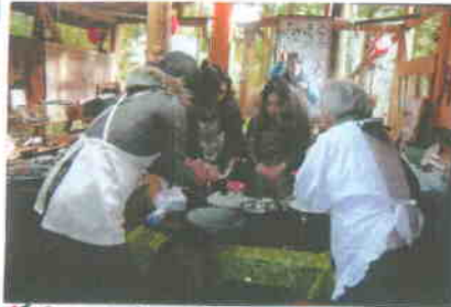
<こちらは、もちを丸めてはてはります>

・木4回、やまぐら結婚応援団 男性8人 女性6人の参加。 ランプの宿29名、一般20人 総勢34人の、寒水夏祭り。 餅つきを楽しみました!!