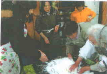
<80歳の女性2人の、お手本です!!>