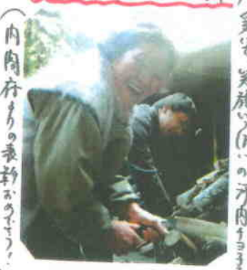
(内肉存りの素朴な「まほう」)