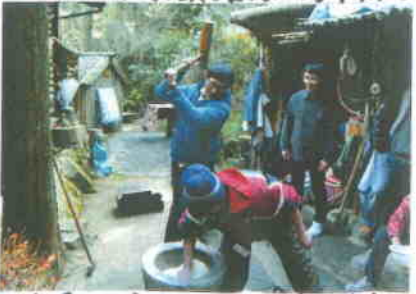
<息を合わせて! 呼吸が大団円>