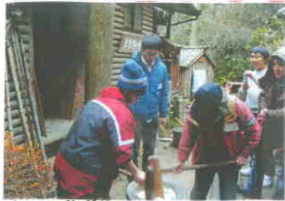
<まず、佐伯管理人と長政のお手本です>