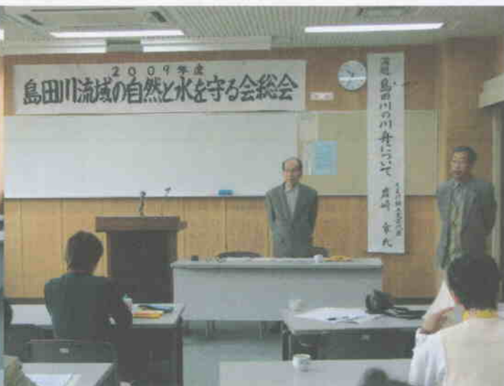
2009年4月26日総会と講演会