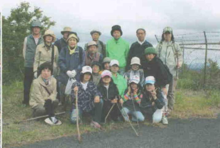
2009年4月26日源九郎山ハイキング