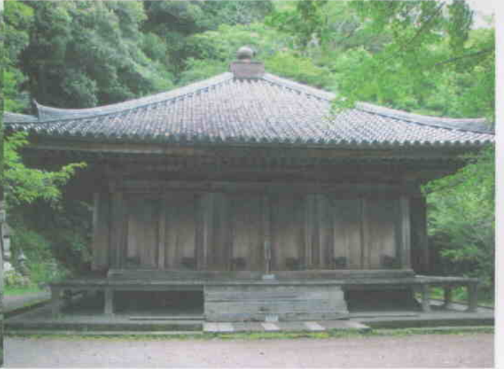
美しく優雅な木造建築の富貴寺にて