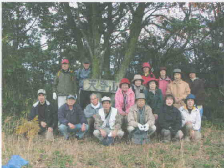
2009年12月6日東善寺川源流ハイキング