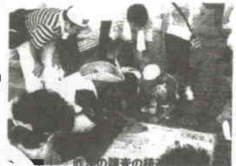
昨年の調査の様子