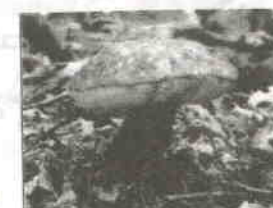
ムラサキヤマドリタケ