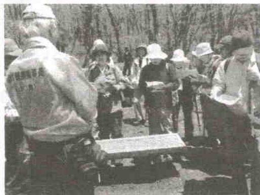
環境学習会風景(左と同一場所)