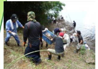
小野湖の清掃作業